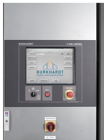
ガス化ユニットのモニター画面（遠隔操作も可能）